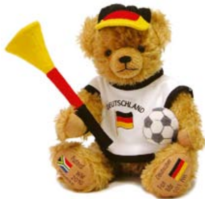
Deutscher Fan Bär WM 2010 (12509-7), 35 cm, Mohair, Wattefüllung, LE 111.