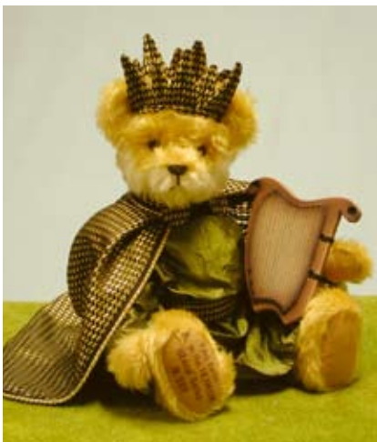
König David (19519-9), 39 cm, Mohair, Holzwolle, Brummst. LE 1000.