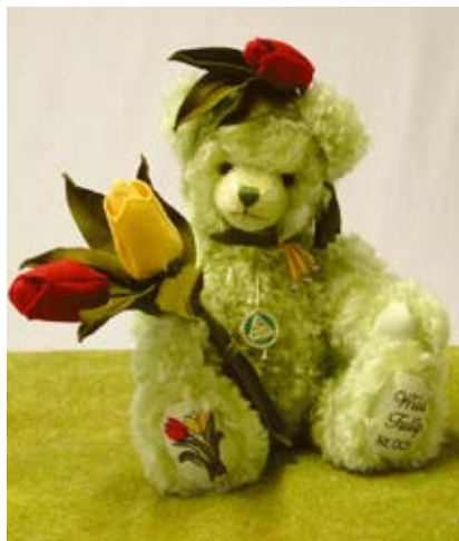
Wild Tulip (20282-8), 36 cm, Mohair, Wattefüllung, LE 500.