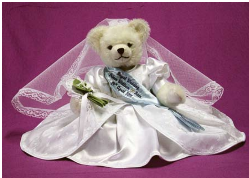
Mit dem aufwendig bekleideten Royal Wedding Bear (Masterpiece) feiert HERMANN die Hochzeit von Prinz William und Kate Middleton.

Gekrönt worden war Elisabeth erst 1953 über ein Jahr nach ihrer Thronbesteigung, und so gab es 2003 einen zusätzlichen Coronation Bear. Insgesamt hat HERMANN bis heute neun Bären herausgebracht, die auf die britische Monarchin Bezug nehmen, davon allein drei im