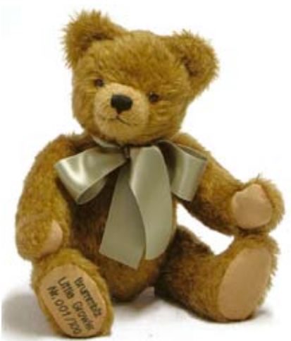
Kleiner Brumbär (11945-4), 36 cm, Mohair, Holzwolle, Zug-Brummst., LE 100.