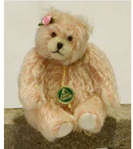
The Spirit of Hermann Jubilee Edition 1920-2010 (10201-2), 36 cm, Mohair, Holzwolle, LE 90, gefertigt von handverlesener Auswahl von Mitarbeitern, mit Unterschriften auf jedem Zertifikat.