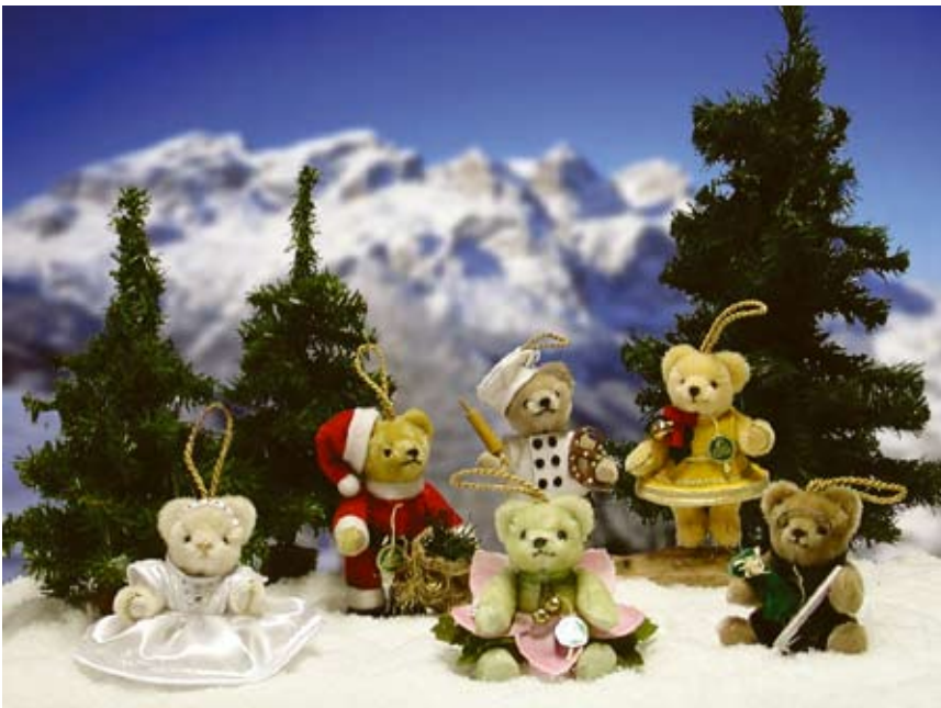
Christmas Ornament Set 2010: Diamond Angel, Classic Santa, Kleine Christrose, Brezel Bäcker, Weihnachtsglöckchen, Bärenstopfer (22177-5), 11 cm, Mohair, Holzwolle, LE 500.