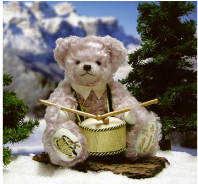
Little Drummer Boy (22375-5), 35 cm, Mohair, Wattefüllung, Musikstimme, LE 35.