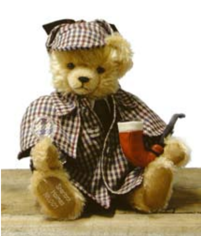
Sherlock Holmes (19318-8), 38 cm, Mohair, Brummst. LE 250.