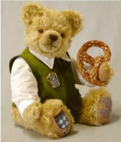
200th Birthday Oktoberfestbär mit Brezel (19953-1), 39 cm, Mohair, Watte, LE 200.