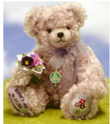
A Mother's Joy (20226-2), 34 cm, Mohair, Wattefüllung, LE 50.