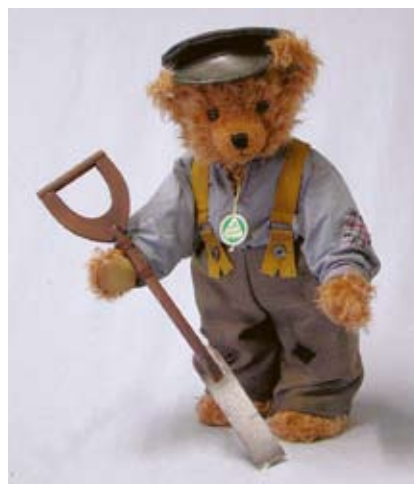
Der Hollandgänger (12719-0), 37 cm, Mohair, Holzwolle, Brummst., LE 60.