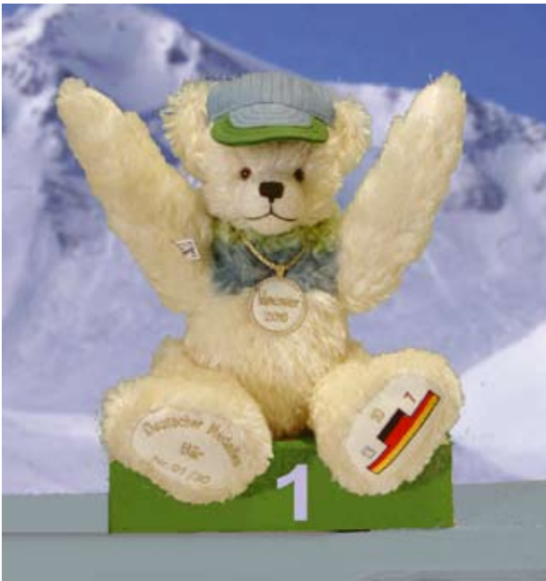
6. Deutscher Medaillen Bär 2010 (12516-5), 38 cm, Mohair, Watte-/Granulatfüllung, LE 30.