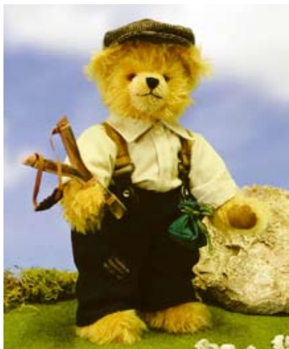
Der Zwispel Bär aus der Reihe der „Sommerspiele“ ist 31 cm groß.