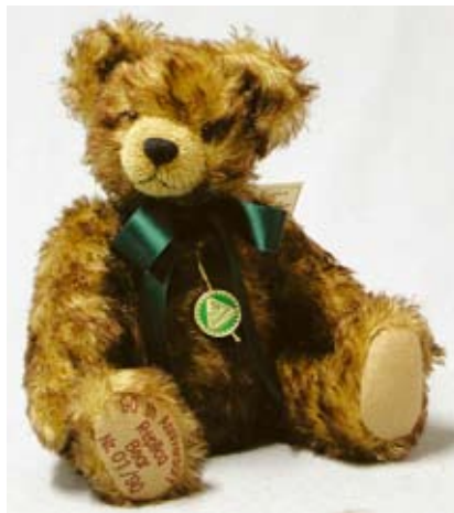
90th Anniversary Replica Bear (10204-03), 35 cm, Mohair, Holzwolle, Brummstimme, LE 90.

Im Durchschnitt entwickelt sie Woche für Woche ein bis zwei neue Designs für das HERMANN