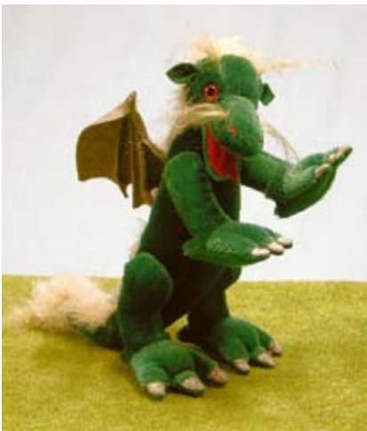
Der astrologische Drache (21005-2), 23 cm, Mohair, Wattefüllung, LE 100..