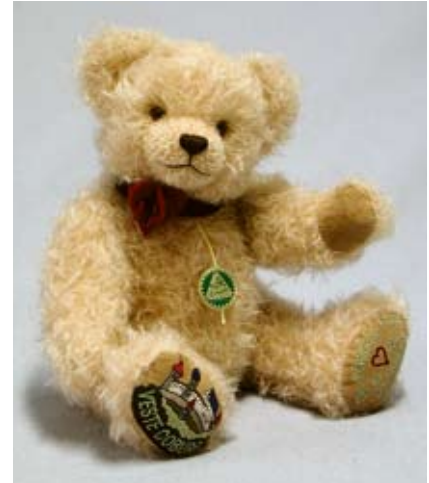
Veste Coburg Bär (12284-3), 34 cm, Mohair, Holzwolle, Brummst., LE 100.