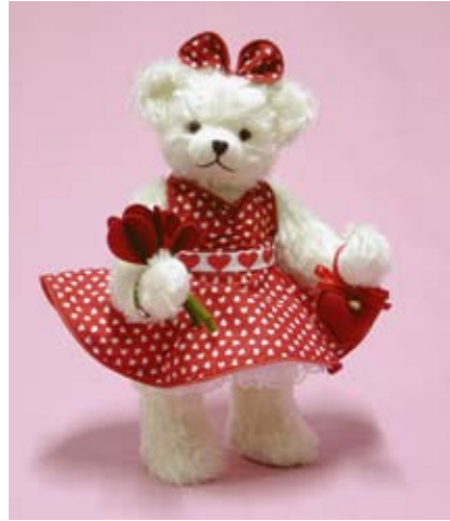
Miss Valentine (20225-5), 32 cm, Mohair, Holzwole, LE 25.