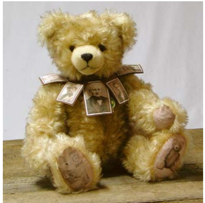
3-Generationen-Bär mit Stammvater (10203-6), 40 cm, Mohair, Holzwolle, Brummstimme, LE 90.