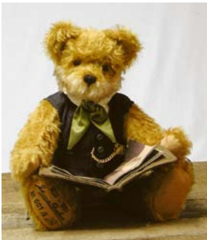
Johannes Brahms (19201-5), 40 cm, Mohair, Holzwolle, Musikst., LE 500.