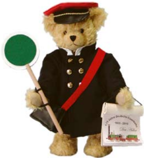
Der Eisenbahner ist 37 cm groß und als Clubedition zum 175-jährigen Jubiläum der deutschen Eisenbahnen erschienen.

hergestellt werden kann. Gefragt ist bei diesem Gewinnspiel Ihr Talent zum Schätzen! Höhepunkt des Clubnachmittags ist die Vorstellung der neuen Clubedition für 2011, die wie im Vorjahr wieder etwas mit dem Thema Mobilität zu tun haben wird. Zum geselligen Ausklang spendiert die Firma HERMANN Thüringer Bratwürste und kühle Getränke. Eine vorherige Anmeldung erleichtert die Planung. Ein Anruf unter 07224/656808 oder eine Email an info@baerenboutique.de genügt.