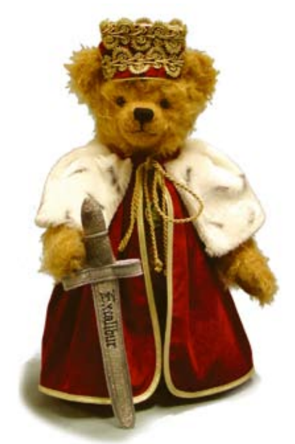
König Artus (19647-9), 36 cm, Mohair, Holzwole, Brummst., LE 100.