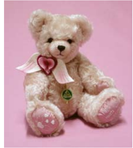
Flying Hearts (20223-1), 34 cm, Mohair, Watte, Musikwerk, LE 50.