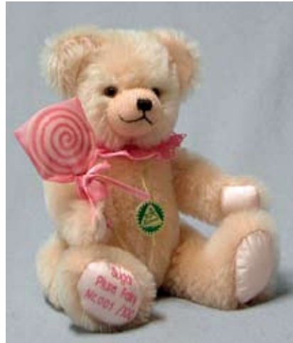
Sugar Plum Fairy (13339-9), 27 cm, Mohair, Wattefüllung, LE 100.