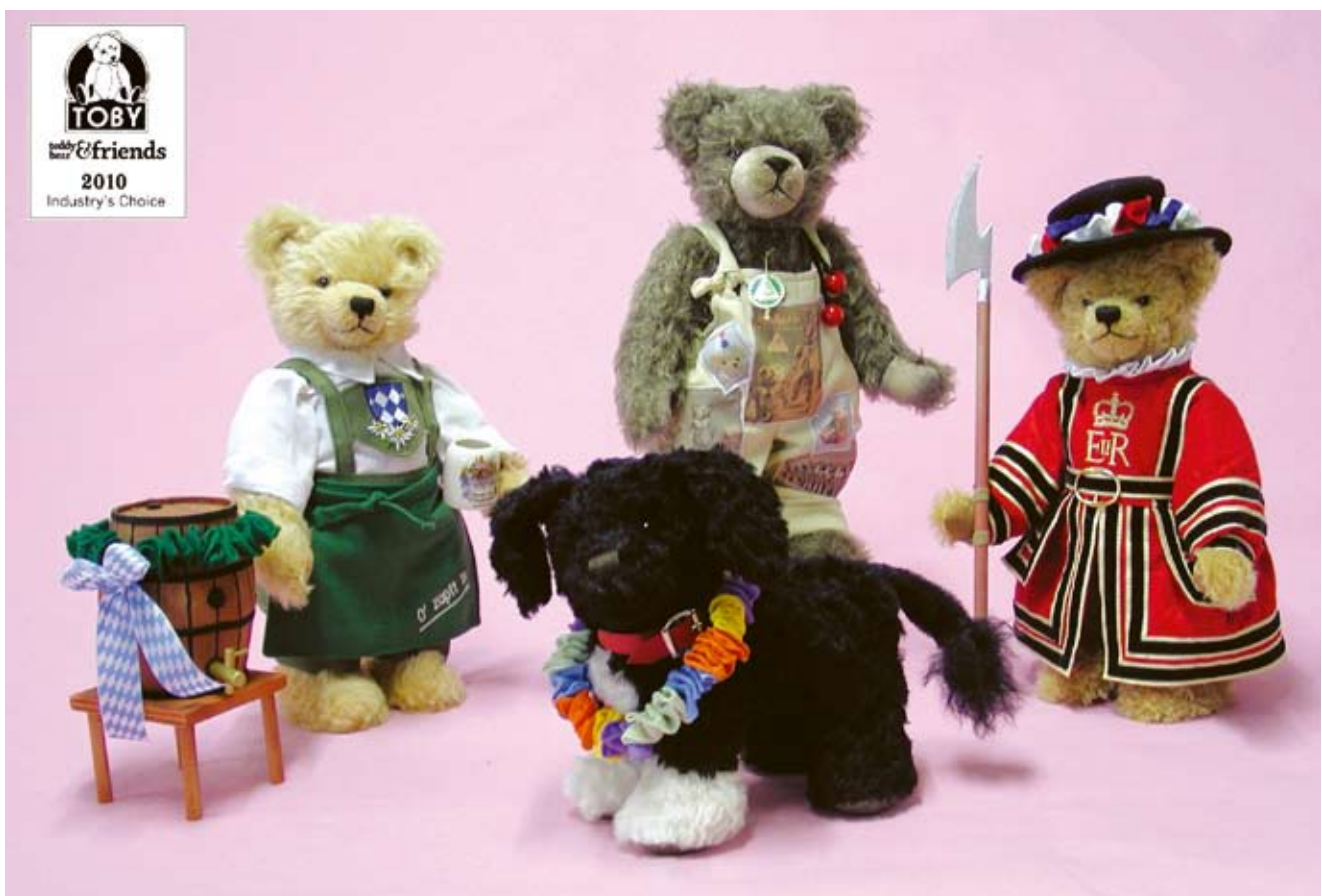
Das HERMANN-Dream-Team des Jahres 2010: Wieswirt „Ozapft is“, First Dog, 16. Sonneberger Museumsbär und Beefeater. Die drei Bären und der Hund gewannen jeweils den TOBY Award Industry's Choice in ihrer Kategorie, die weltweit bedeutendste Teddybär- und Plüschtier-Auszeichnung.

Bären. Dabei gelingt ihr seit mehr als einem Vierteljahrhundert der Spagat, die Artikel einerseits als HERMANN-Produkte erkennbar zu halten und andererseits immer wieder soviel Neues in die Entwürfe einzubringen, dass das Sammeln über lange, lange Zeit ein Quell der Freude bleibt. Dafür sei ihr an dieser Stelle einmal herzlich gedankt!