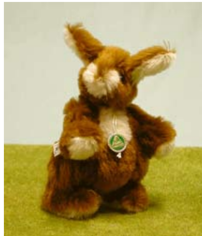
Der astrologische Hase (21004-5), 16 cm, Mohair, Wattefüllung, LE 100.