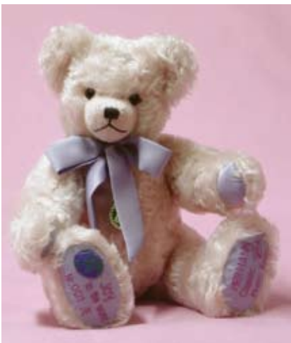
Joy to the World (14314-5), 35 cm, Mohair, Musikst., LE 500.