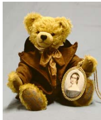
Der 40 cm große Robert Schumann setzt die Reihe der Komponisten fort.

Sehr unglücklich verlief auch das Leben von Ludwig II., dem bayerischen Märchenkönig, dem derzeit