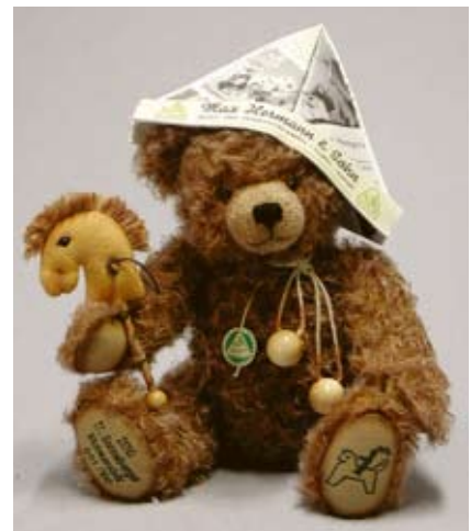
17. Sonneberger Museumsbär (12189-1), 38 cm, Mohair, Holzwolle, LE 100.