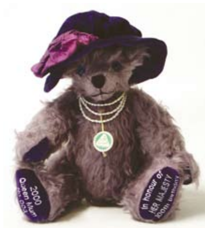
Mit „in honour of Queen Mum“ beginnt im Jahr 2000 die Teddybär-Reihe „The Royal Series“.

Es war die Traumhochzeit des Jahres, wenn nicht des Jahrzehnts: Hunderte Millionen Menschen auf der ganzen Erde verfolgten in Fernsehen und Internet, wie sich Prinz William und Kate Middleton in Westminster Abbey das Ja-Wort gaben. Die ungebrochene Anziehungskraft der britischen Monarchie zählt zu den interessantesten Phänomenen des 21. Jahrhunderts. Auch die Firma HERMANN hat der englischen