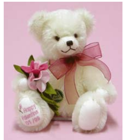
Happy Valentine (20222-4), 28 cm, Mohair, Wattefüllung, LE 99.