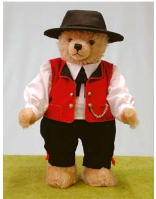
Schwarzwaldjunge (19977-7), 37 cm, Mohair, Holzwolle, Brummst., LE 250.