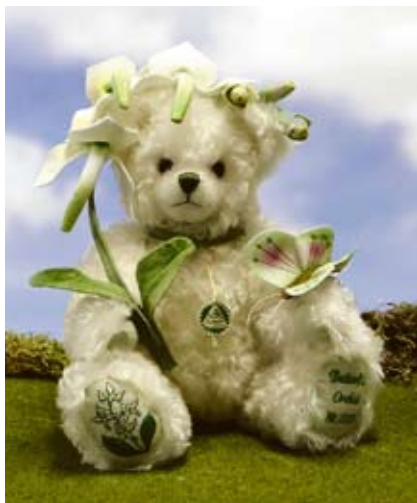
Butterfly Orchid – Waldhyazinthe aus der Reihe der Blumenkinder besitzt eine aufwändige Blumendekoration aus Filz.