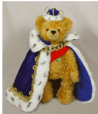
König Ludwig II. von Bayern erscheint zum 125. Todestag des Monarchen.

Eine der bemerkenswertesten HERMANN-Neuheiten von 2011 versteckt sich im Körper des Brumm-Brumm-Bären Maxi (Art.-Nr. 16301/03). Die Coburger Firma hat für den Teddy im klassischen Stil eine neuartige Doppel-Kipp-Brummstimme entwickelt. Er brummt deshalb erstmals bei beiden Bewegungsrichtungen, sowohl beim Neigen nach vorne wie nach hinten. Der mit einer grünen Seidenschleife geschmückte Maxi ist in drei Größen, in 38, 46 und 58 Zentimetern, erhältlich.