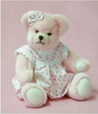
Vintage Little Sweetheart (20224-8), 23 cm, ant. Webplüsch, Watte, LE 50.