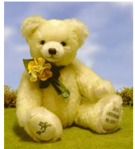
Jahresbär 2011 Sunny (15201-7), 39 cm, Mohair, Holzwolle, Brummst., Jahreslimit.