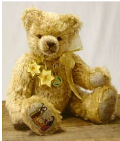
Weihnachtsbär 2010 (15202-4), 40 cm, Mohair, Brummst., Jahreslimitierung.