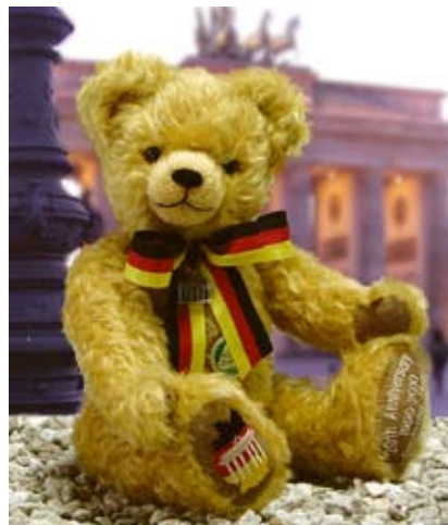
Brandenburger Tor Bär (12147-1), 36 cm, Mohair, Wattefüllung, LE 200.