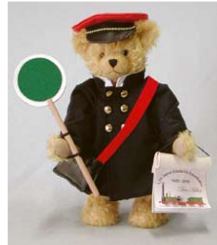
Eisenbahner (Club-Edition) (12416-8), 37 cm, Mohair, Brummst. LE 50.