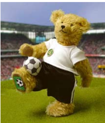
Fußball Bär HERMANN 11 (12405-2), 31 cm, Mohair, Holzwolle, LE 99.