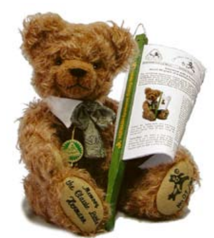
Memory - the Classic Little Hermann (10202-9), 33 cm, Mohair, Brummst., LE 90.