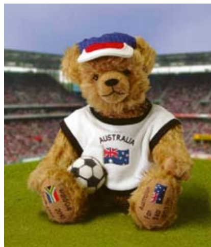
Australian Fan Bear (12507-3), 35 cm, Mohair, Wattefüllung, LE 111.