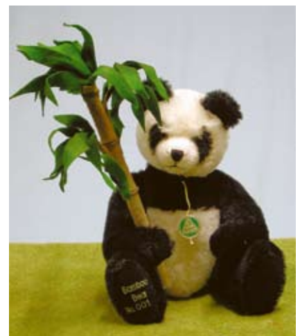
Bamboo Bear (20124-1), 35 cm, Mohair, Holzwolle, Brummst., LE 150.