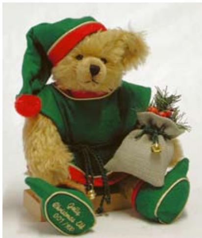
Jolly Christmas Elf (22376-2), 38 cm, Mohair, Wattefüllung, LE 100.