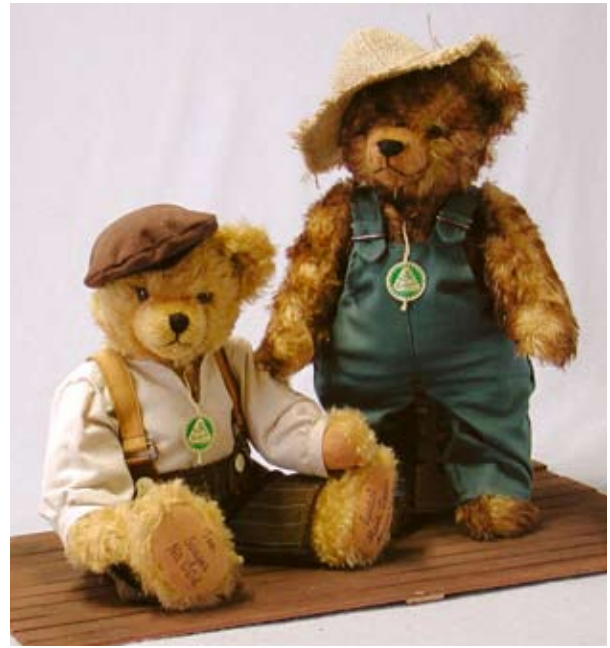
Tom Sawyer und Huckleberry Finn (Special Edition) (19292/19293), 34 cm, Mohair, Holzwolle, LE 100.