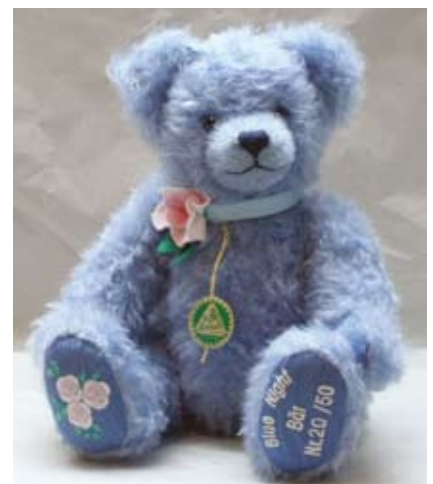
Blue Night Bär (12203-4), 30 cm, Mohair, Holzwolle, Musikst., LE 50.