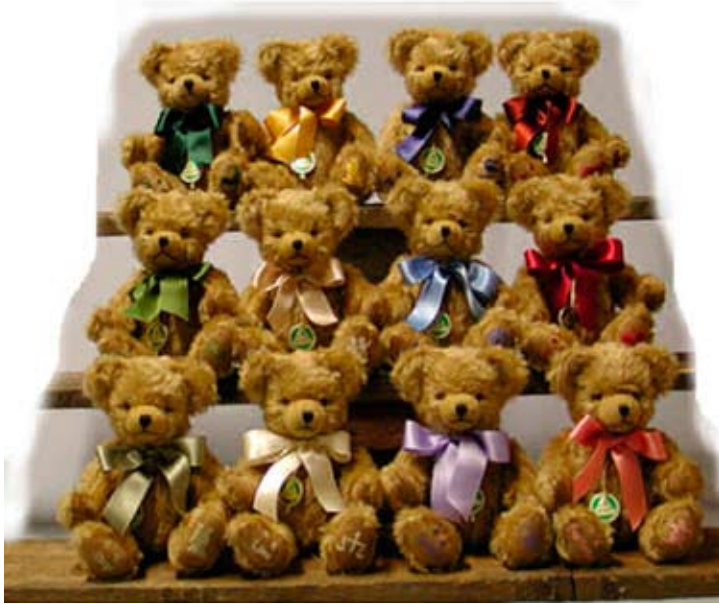
Sternzeichen Bären (20041-20052), 23 cm, Mohair, Wattefüllung, ohne Limitierung....