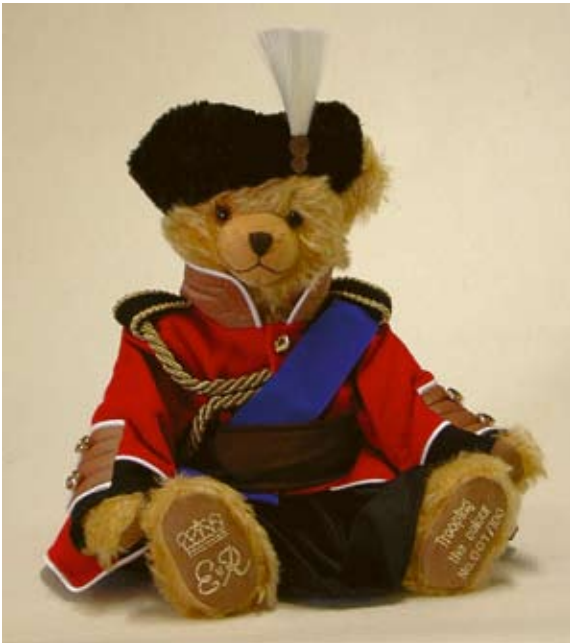
Trooping the Colour (13206-4), 40 cm, Mohair, Holzwolle, Brummstimme, LE 100.