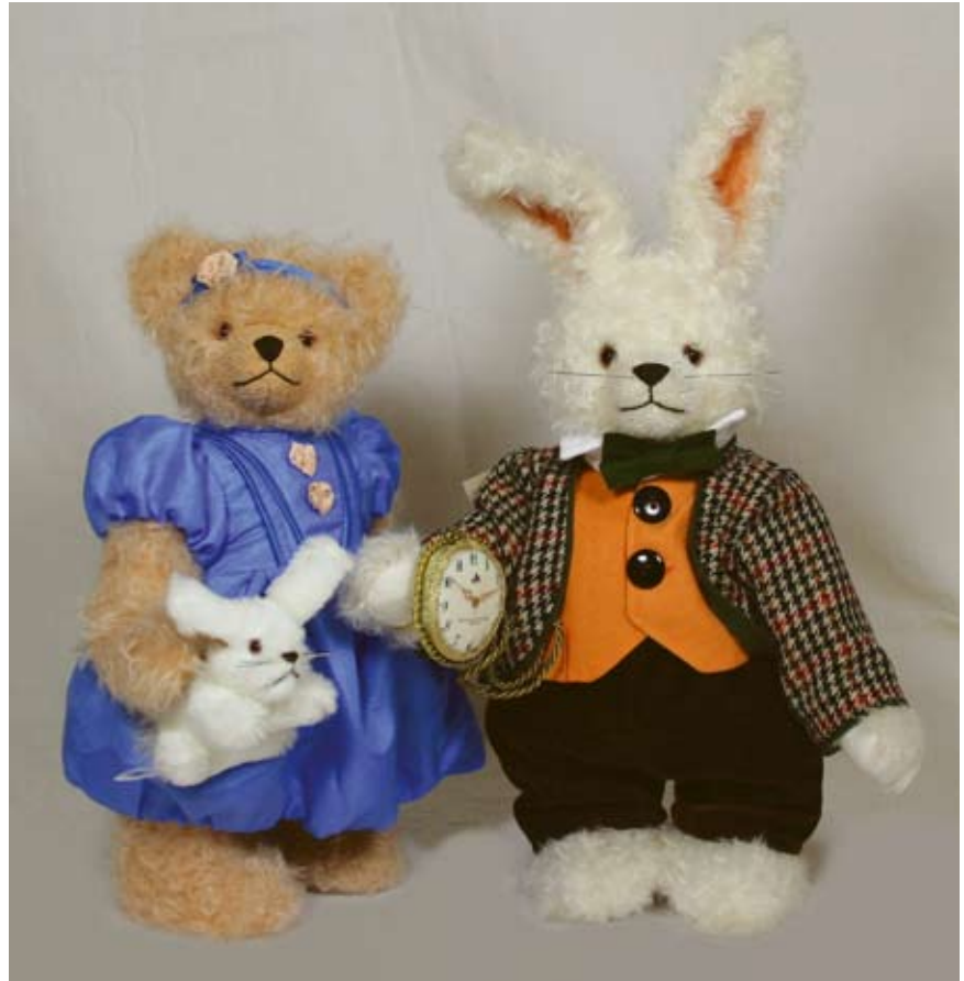
Alice im Wunderland und White Rabbit sind 32 cm bzw. 30 cm groß (beim Kaninchen ohne die Ohren gemessen!) und auf jeweils nur 100 Exemplare limitiert.

Reihe der „Sommerspiele“ vor. Der neue Bär wird traditionell auf der Messe „Teddybär Total“ erstmals der Öffentlichkeit präsentiert. Diesmal hat Ursula Hermann sich für ein typisches Jungenspiel entschieden, das Schießen mit der Schleuder. Ihr Zwispel Bär (Art.-Nr. 12425-0) ist ein richtiger Lausbub geworden. Hoffen wir, dass alle Fensterscheiben heil bleiben! ■