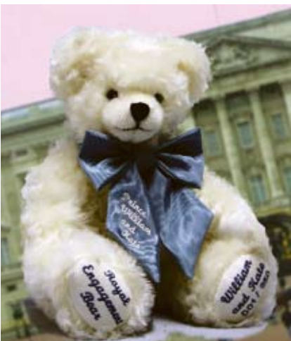
Royal Engagement Bear (13205-7), 35 cm, Mohair, Wattefüllung, LE 250.