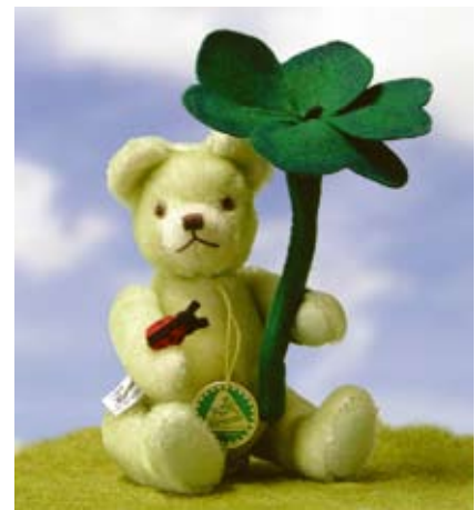
HERMANN Club Bär 2011 (12406-9), 19 cm, Mohair, Holzwolle, Jahreslimitierung.

Sortiment – von der ersten Idee über die Ausarbeitung eines Konzepts und die Gestaltung verschiedener Muster bis zum fertigen