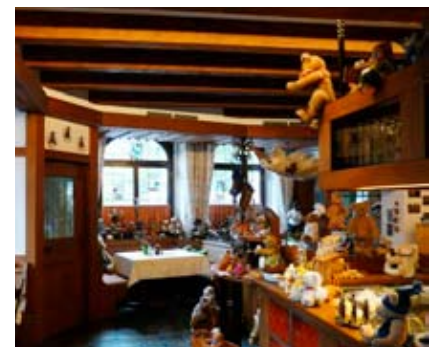
Teddys, soweit das Auge reicht. Der Peterhof ist ein Hotel für Bärenliebhaber.

Gut gesättigt gingen wir wieder auf unser Zimmer, unschuldig, aber irgendwie verändert schauten uns