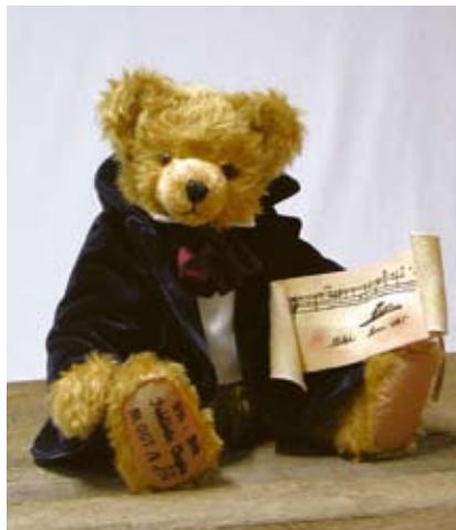
Frédéric Chopin (19208-2), 40 cm, Mohair, Holzwolle, Musikst., LE 500.