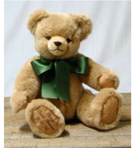
Vintage Classic Hermann (11977-5), 37 cm, ant. Webplüsch, Wattefüllung, LE 50.