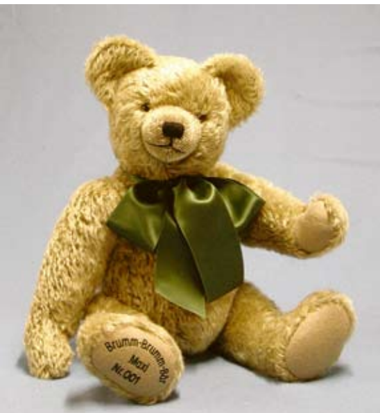
Brumm-Brumm-Bär Maxi brummt bei jeder Neigung seines Körpers, gleich ob nach vorne oder nach hinten.