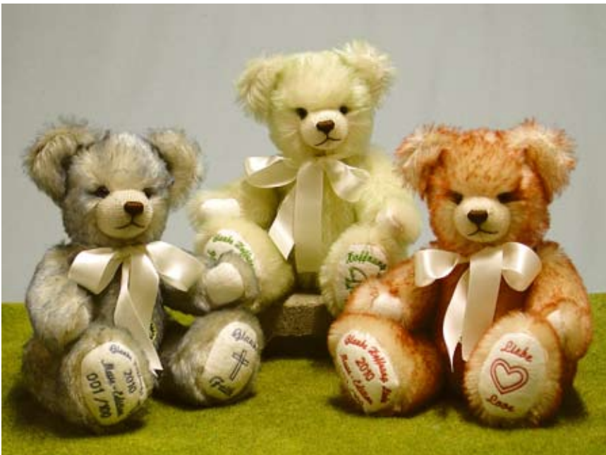
Glaube, Hoffnung, Liebe (10606-5), Messe-Sonderedition 2010, 29 cm, Mohair, Wattefüllung, LE 100.