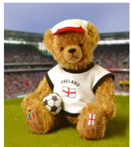
English Fan Bear (12508-0), 35 cm, Mohair, Wattefüllung, LE 111.