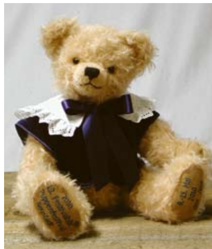
Festival Bär 2010 (12179-2), 39 cm, Mohair, Holzwole, LE 100 (Festivaled.)