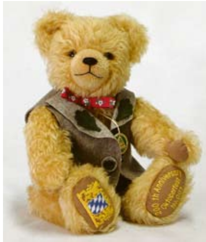
200th Anniversary Oktoberfest Bear (13334-4), 35 cm, Mohair, Watte, LE 555.