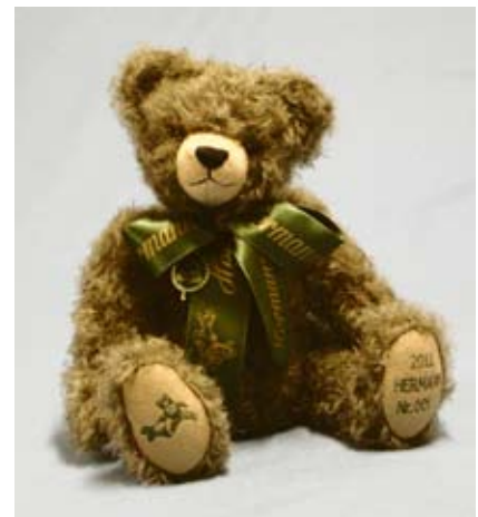
Der HERMANN Jahresbär 2011 „Old Boy“ ist 36 cm groß und mit Holzwolle gefüllt.

Freiluft-Aktivitäten für Kinder an schönen Sommertagen stellt seit sechs Jahren die HERMANN-