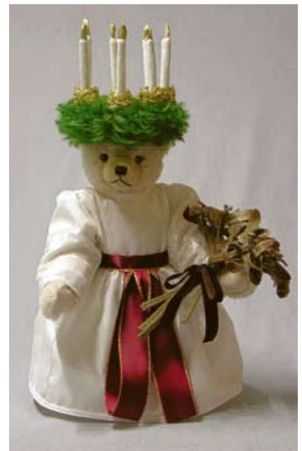
Die Lichterkönigin – Heilige Lucia (19550-2), 40 cm, Mohair, Brummst., LE 100