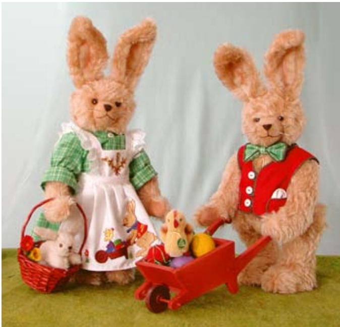
Mr. und Mrs. Bunny (21213/21214), 37 cm, Mohair, Holzwolle, LE 50.