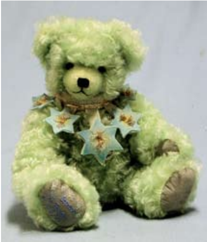
Sternenzauber (22380-9), 34 cm, Mohair, Wattefüllung, Musikst., LE 10.